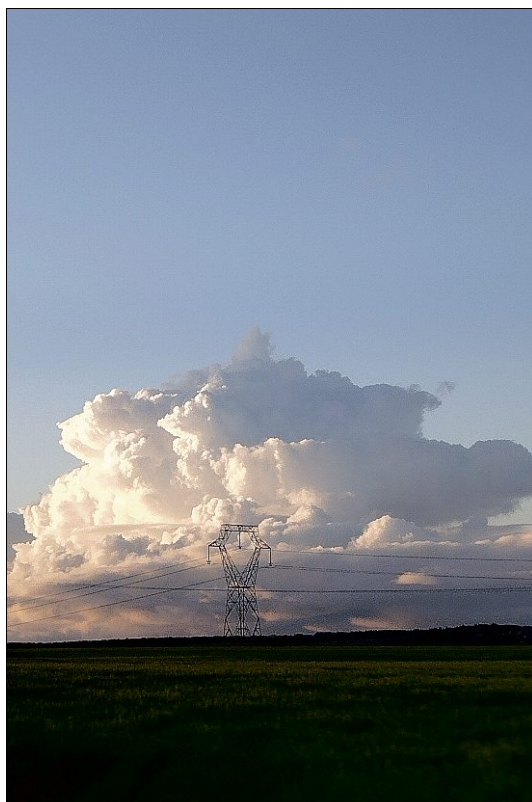
EXEMPLES. Ces deux clichés, capturés par Lucyle Jover (à gauche) et Cyrille Malonga (à droite) lors de l'atelier photographie avec Jean-François Spricigo, font partie de la sélection finale qui sera exposée.

Dès les vacances de Noël, les élèves ont dû prendre une vingtaine de clichés. Des autoportraits, paysages ou encore des morceaux de nature sans présence humaine. « Ils se sont tous investis. Lors de la première séance, ils ont passé la journée à projeter des images, dans le noir. Il s'est passé quelque chose, il y a eu une vraie ren-